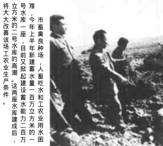
市畜牧良种场，人畜吃水和工农业用水的统一工程，今年上半年新建蓄水池一座，容量达二万方，解决了该场长期以来人畜吃水和工农业用水的统一问题。

走进颜徐镇，人们感觉到近年来发生了很大变化，这里的政治、经济、文化与各项社会事业不断迈上新台阶；1996年10月撤乡设镇，全镇1996年实现总产值7亿元，比1995年增长55.6%，人均纯收入2300元，比1995年增加592元，连续5年被市委、市政府授予“十强乡镇”称号，连续8年被市委、市政府授予“农业机械化冠军”。今年1至9月份，已实现社会总产值7.6亿元，人均纯收入2100元。谈起这喜人的变化，颜徐人民总会赞扬镇党政“一班人”一心为群众办事、为民造福的事迹。